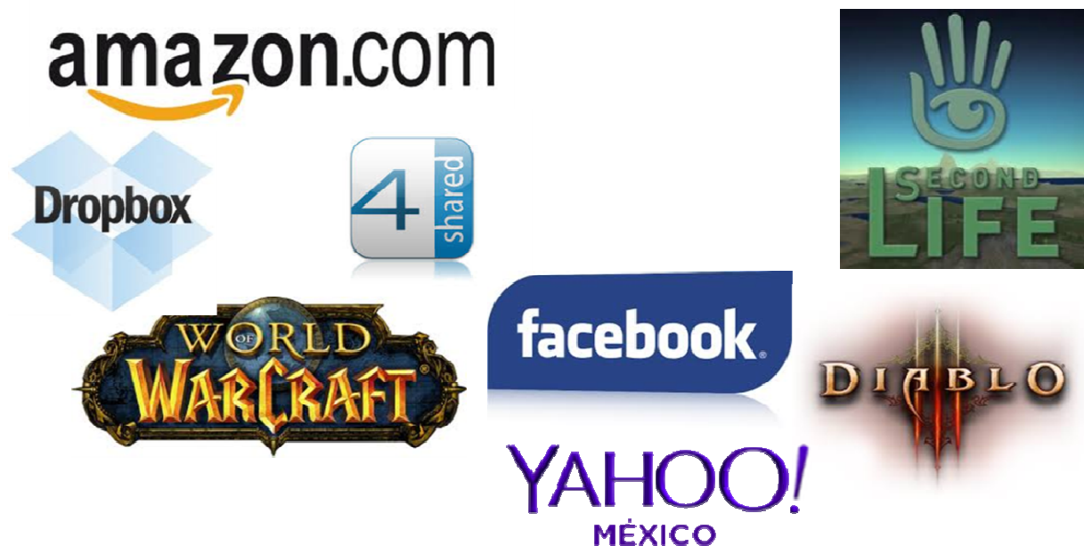
Figura 2. Logos de soluciones virtuales ofertadas en el ciberespacio

Aunque hay una variación de entendimiento entre autores, de una manera simplificada, se puede decir que la computación en la nube ( cloud computing ) es una de las principales estrategias para generar productos y servicios de Internet. Pero esta definición no dice mucho, en cuyo caso, algunas imágenes pueden ser de gran valor. La Figura 2 representa varias logos. ¿Qué representan estas imágenes? ¿Hay algo de geográfico en ellos?