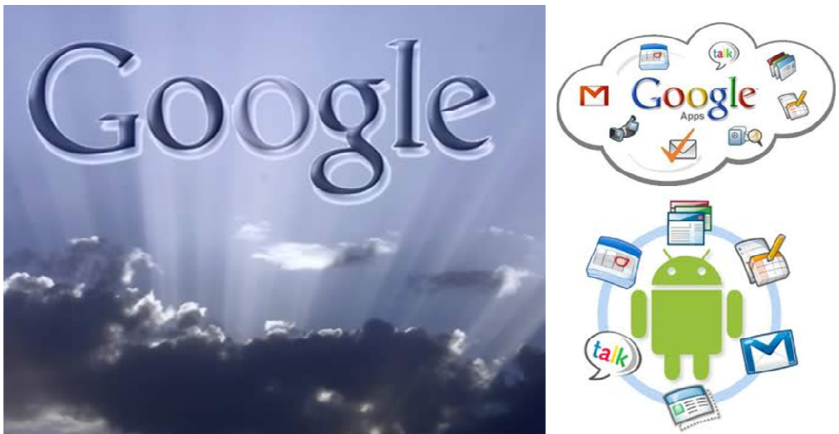
Figura 3. Las llamadas “suites de servicios” o “suites de soluciones” Google

más la idea de la computación en nube, con la Figura 3.